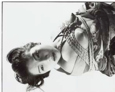
Nobuyoshi Araki, Ohne Titel (aus der Serie „Tokyo Comedy“), 1997