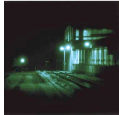
Thomas Ruff, Nacht 15 III, 1994, © VG-Bildkunst 2010