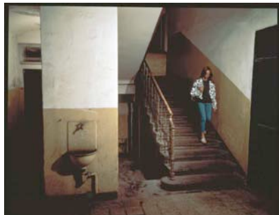
Jeff Wall, Odradek, Taboritská 8, Prag, 18. Juli, 1994